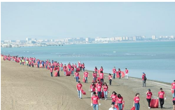
Image 2 : Participants au World CleanUp Day sur une plage d'Estonie

C'est ainsi que le 15 septembre 2018 , partout dans le monde, des millions de citoyens vont participer à la plus grande mobilisation citoyenne et environnementale de l'histoire, en agissant collectivement pour nettoyer la planète.